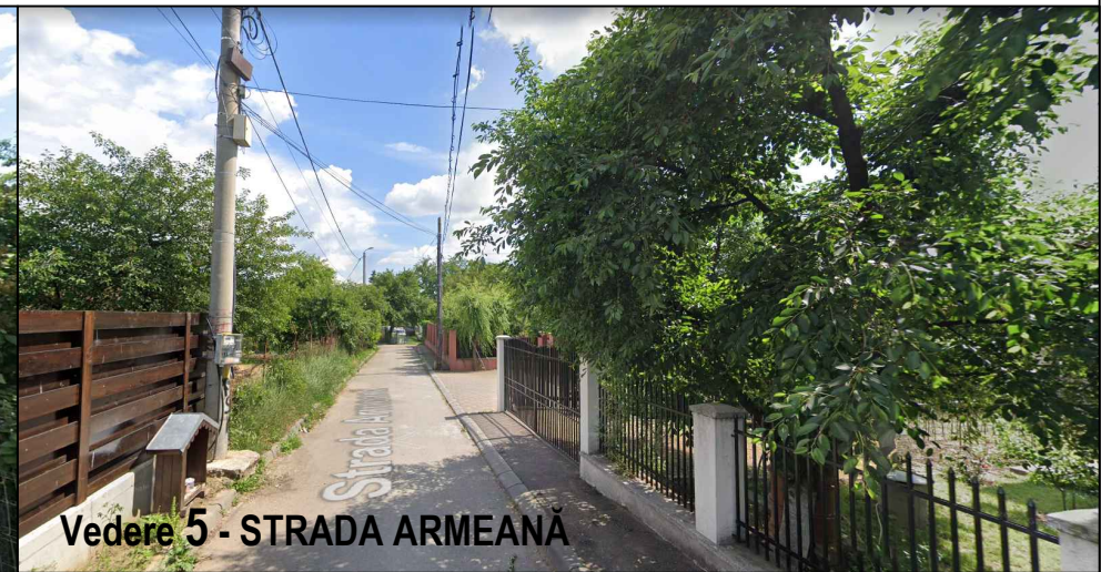
Vedere 5 - STRADA ARMEANĂ