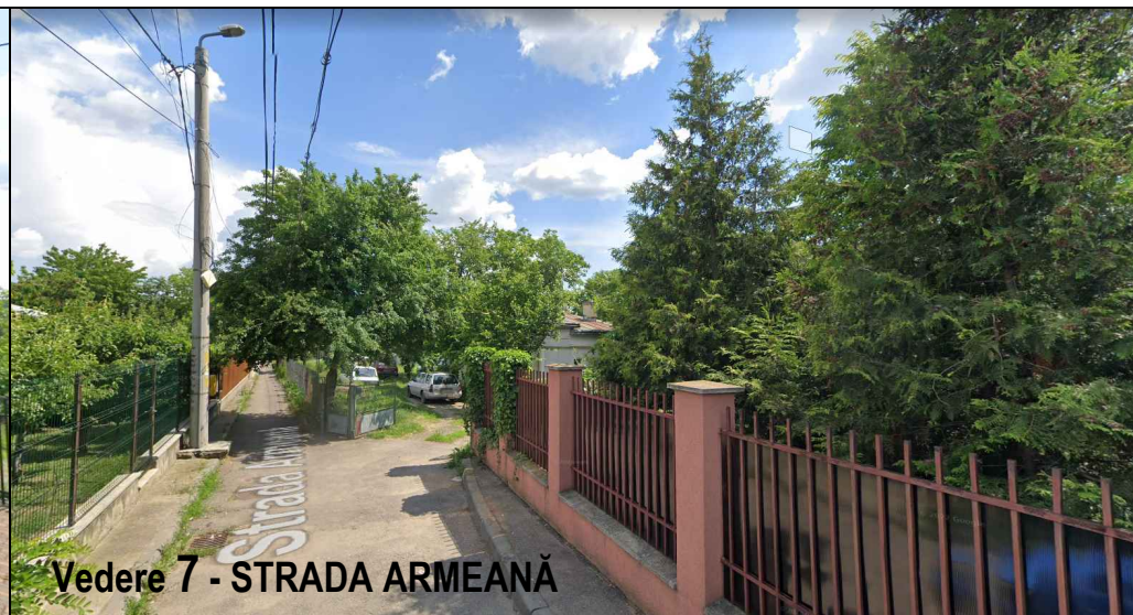
Vedere 7 - STRADA ARMEANĂ