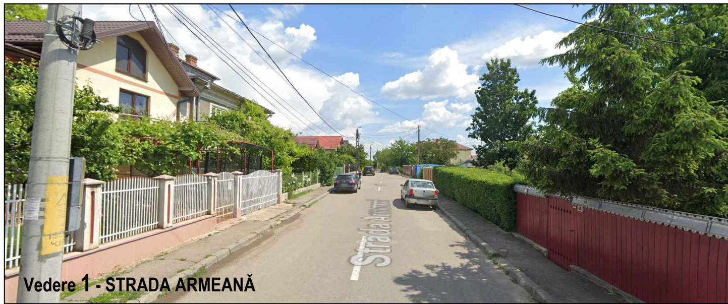
Vedere 1 - STRADA ARMEANĂ