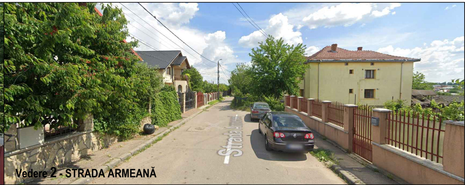
Vedere 2 - STRADA ARMEANĂ