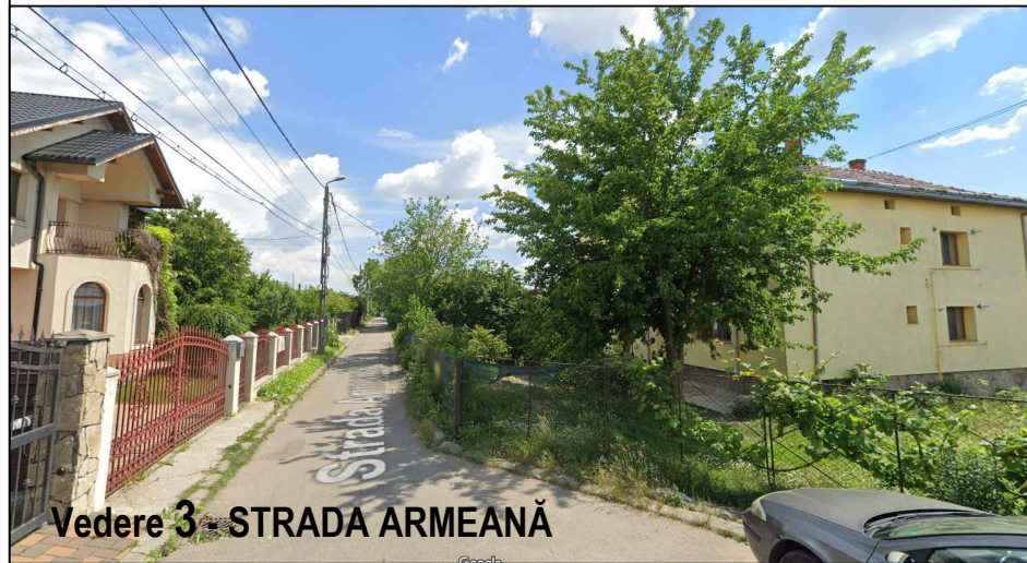
Vedere 3 - STRADA ARMEANĂ