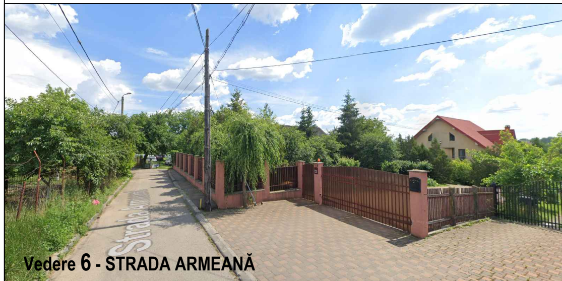
Vedere 6 - STRADA ARMEANĂ