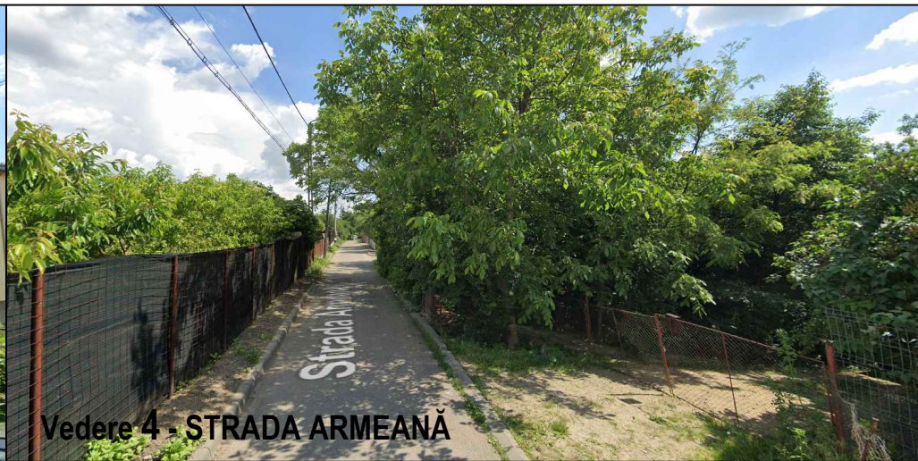
Vedere 4 - STRADA ARMEANĂ