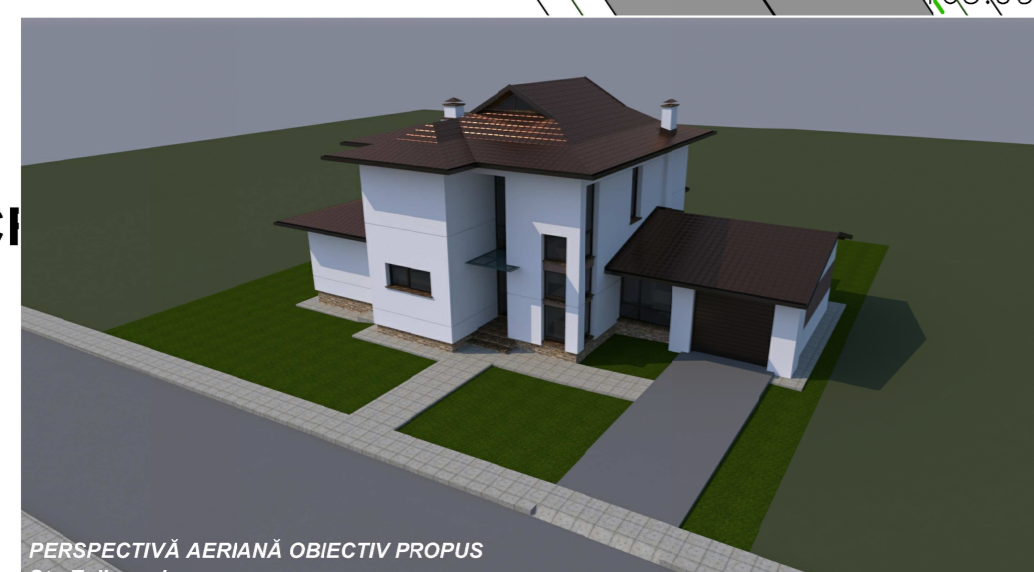
PERSPECTIVĂ AERIANĂ OBIECTIV PROPUS Str. Tulbureni