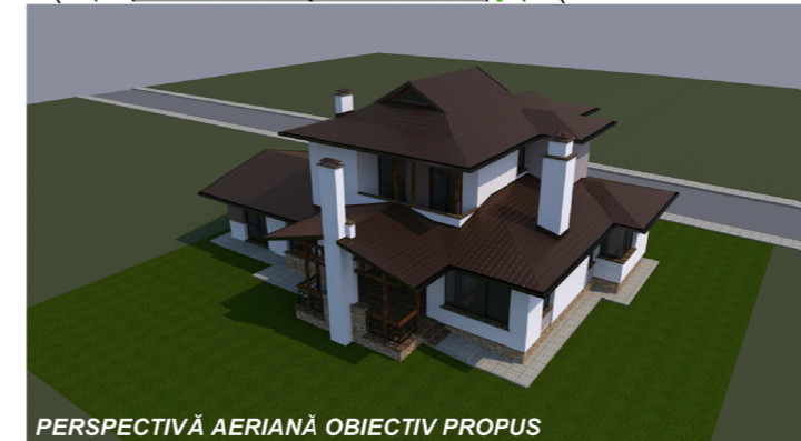
PERSPECTIVĂ AERIANĂ OBIECTIV PROPUS